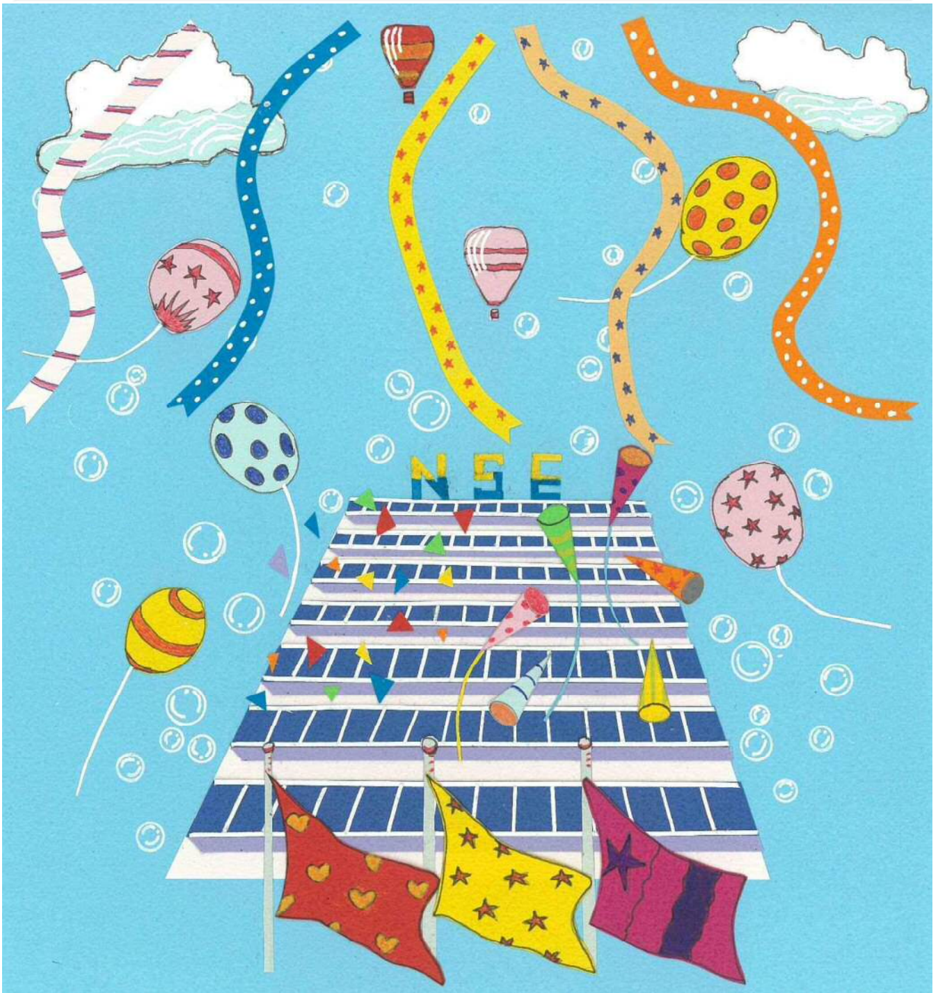
『NSE 本社ビル』 切り絵